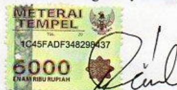
Denti Arum Sari