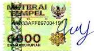
Safrida Edwin irana