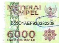
Akmala Nur Aini