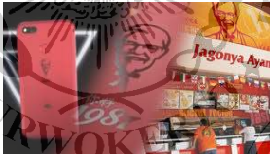
Gambar 2.4 contoh slogan iklan

Iklan juga tak jarang menambahkan slogan pada saat promosinya, untuk membedakan iklan tersebut dengan iklan yang lain. Contohnya: a) KFC, Jagonya Ayam..!!, b) KFC, Finger lickin' good, c) PIZZA HUT, Good Friends Great Pizza, d) Teh rio, Asli segarnya, e) Buavita, Buavita Khas Nusantara.