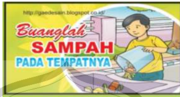
Gambar 2.3 contoh slogan lingkungan