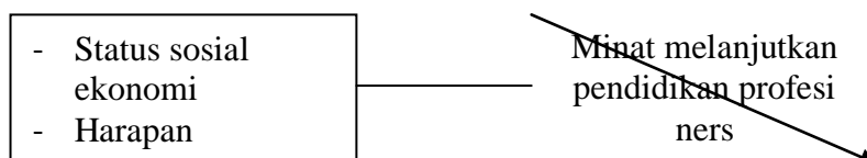
Gambar 2.2 Kerangka Konsep