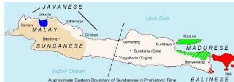
Gambar 2.1 Peta Wilayah Bahasa Jawa

diucapkan secara berbeda pada semua kosakata. Berikut ini adalah peta penyebaran bahasa Jawa.