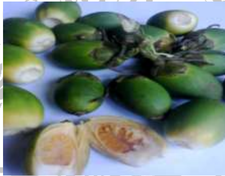
Gambar 2.2 Kulit Biji Pinang

Pinang ( Areca catechu L.) adalah sejenis palma yang tumbuh di daerah Pasifik, Asia dan Afrika bagian Timur. Jenis buah ini yang di dunia Barat dikenal dengan betel nut , terutama ditanam untuk dimanfaatkan bijinya. Biji pinang diperoleh dari buah pinang yang telah dikupas. Biji pinang dikenal sebagai salah satu campuran makan sirih. Selain itu, biji pinang dapat dijadikan bahan campuran permen, dimanfaatkan sebagai zat pewarna merah alami, dan diekstrak zat-zat antioksidan alami yang menguntungkan seperti tanin.