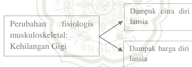
Bagan 2.2 Kerangka Konsep

Berdasarkan landasan teori menurut Martono dan Pranaka (2011) dan Potter & perry (2005) dapat disusun kerangka konsep yang telah dimodifikasi sebagai berikut :