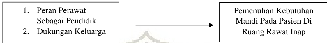
Gambar 2.2: Kerangka Konsep Penelitian