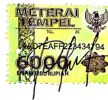
Restu Dwi Lestari