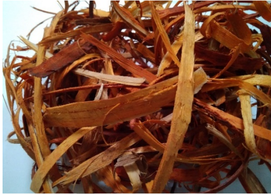
Gambar 2.1. Kayu Secang

Suku : Cesalpiniaceae Marga : Caesalpinia Jenis : Caesalpinia sappan L