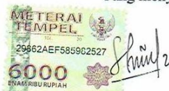
Febriana Nurul Suci

Dibuat di : Purwokerto Pada tanggal : 13 Januari 2018 Yang menyatakan,