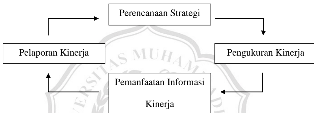
Gambar 2.1 Siklus Akuntabilitas Kinerja Instansi Pemerintah

Siklus akuntabilitas kinerja instansi pemerintah seperti terlihat pada gambar di atas, dimulai dari penyusunan perencanaan strategi (Renstra) yang meliputi penyusunan visi, misi, tujuan, dan sasaran serta menetapkan strategi yang akan digunakan untuk mencapai tujuan dan sasaran yang ditetapkan. Perencanaan strategik ini kemudian dijabarkan dalam perencanaan kinerja tahunan yang dibuat setiap tahun.