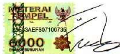
Saleh Al Vicks Faiz