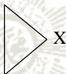
Gambar 2.1 Gambar Sederhana X pada Tes Gaya kognitif GEFT

Bentuk sederhana “X” tersembunyi pada gambar rumit di bawah ini: