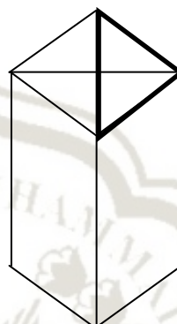
Gambar 2.3 Gambar Sederhana X dalam Gambar Rumit pada Tes Gaya Kognitif GEFT

Jawabannya adalah seperti gambar di bawah ini: