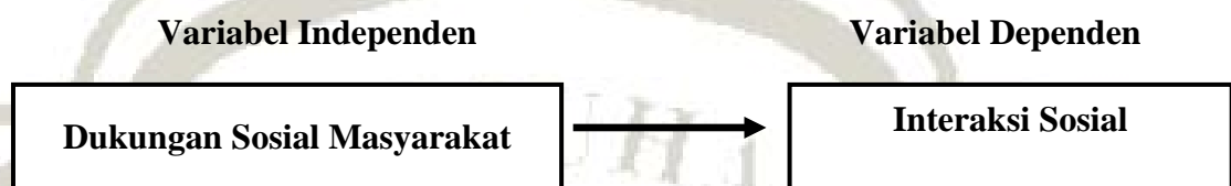
Gambar 2.2 Kerangka konsep penelitian Hubungan Antara Dukungan Sosial Masyarakat Dengan Interaksi Sosial lansia di Desa Panusupan Kecamatan Cilongok Kabupaten Banyumas