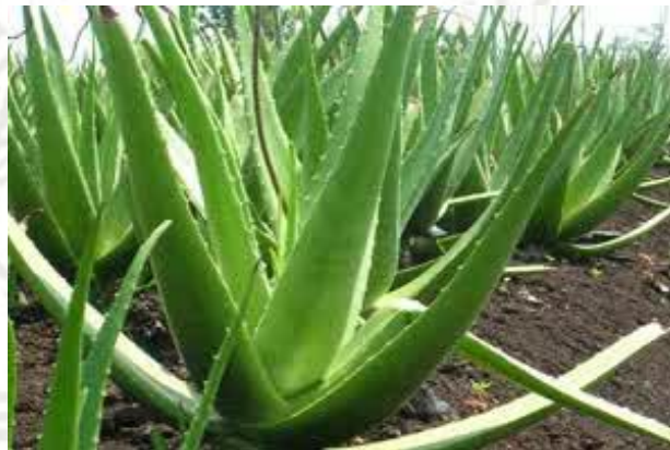
Gambar 2.2 Lidah Buaya ( Aloe vera )

tanah. Daun berbentuk pita dengan helaian yang memanjang, berdaging tebal, tidak bertulang, berwarna hijau, bersifat sukulen (banyak mengandung air), dan banyak mengandung getah dan lendir (gel) berwarna kuning, ujung meruncing, permukaan daun dilapisi lilin dengan duri lemas tepinya, dan panjang mencapai 50-75 cm dengan berat 0,5-1 kg. Bunga berwarna kuning atau kemerahan. Akar berupa akar serabut yang pendek dan berada di permukaan tanah (Anonim, 2008).