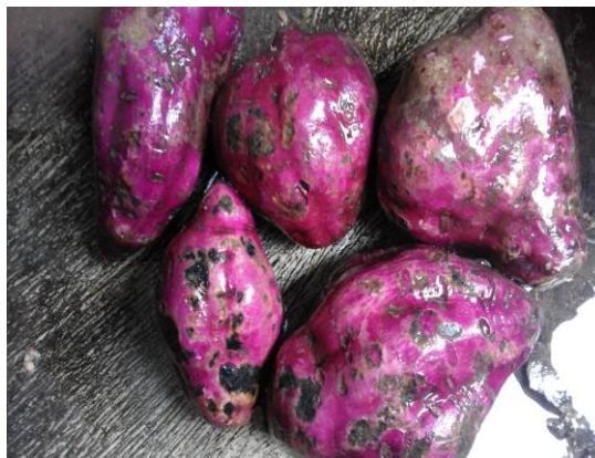
Gambar 2. 1. (Sumber peneliti)

Kingdom : Plantea Devisi : Spermatophyta Kelas : Dicotylodonnae Ordo : Convolvulales Famili : Convolvulaceae Genus : Ipomoea (Rosita, 2015)