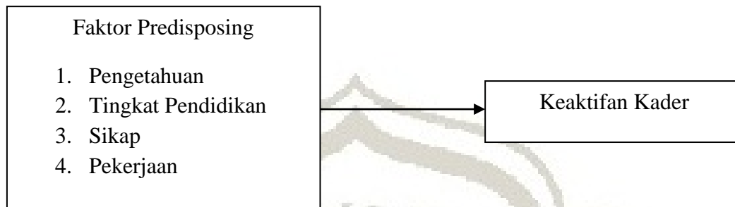
Gambar 2. Kerangka Konsep