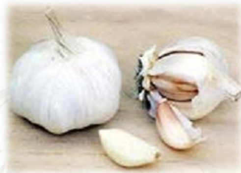
Gambar 1. Bawang putih, Allium sativum (Thongcharoen,2007).