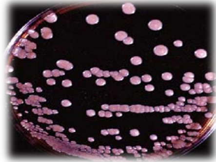
Gambar 3. Malassezia furfur (Ellis.D,2007)

Klasifikasi Malassezia furfur adalah sebagai berikut :