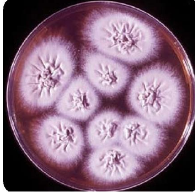
Gambar 2. Trichophyton mentagrophytes (Ellis.D,2007 )

Klasifikasi Trichophyton mentagrophytes adalah sebagai berikut :