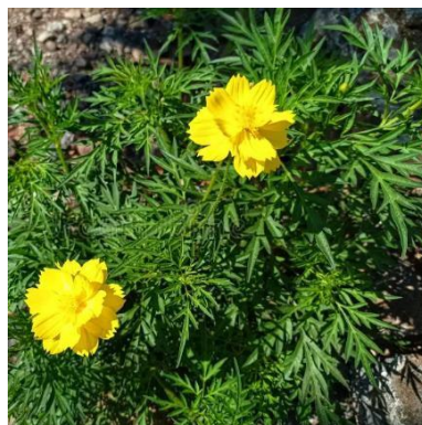
Gambar 2. 2 Spesies ( Cosmos sulphureus . Cav)

Kenikir ( Cosmos sulphureus ) merupakan tanaman herba dengan bunga berwarna kuning cerah hingga jingga serta memiliki rasa pahit. Tanaman ini memiliki batang tegak, kuat, dan bercabang banyak, dengan tinggi yang dapat mencapai sekitar 2 meter. Daunnya berwarna hijau, berbentuk oval hingga lanset, dengan panjang 50–250 mm, berlekuk dalam, ujung apikulat, serta tangkai daun sepanjang 10–70 mm. Bagian daun dan akar Cosmos sulphureus diketahui mengandung berbagai senyawa bioaktif, antara lain fenol, tanin, flavonoid, dan saponin. (Himanshu, Kaur and Singh Sohal, 2024)