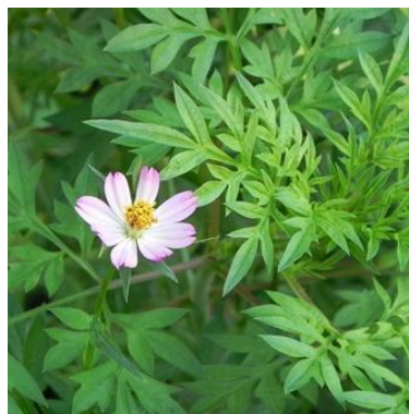
Gambar 2. 1 Spesies ( Cosmos caudatus . Kunth)

Kenikir ( C. caudatus ) merupakan tanaman perdu dengan tinggi sekitar 75–100 cm. Tanaman ini memiliki akar tunggang berwarna putih, batang tegak dan kokoh dengan banyak cabang, serta ruas batang berwarna hijau keunguan. Daunnya berupa daun majemuk berwarna hijau dengan susunan menyirip. Bunganya berbentuk bongkol majemuk dengan delapan helai mahkota berwarna merah muda hingga ungu, sedangkan buahnya keras, berbentuk seperti jarum dengan ujung berambut. Daun kenikir jenis ini mengandung berbagai senyawa bioaktif, antara lain flavonoid, alkaloid, saponin, steroid, terpenoid, dan asam fenolik (Fuzzati et al. , 1995).