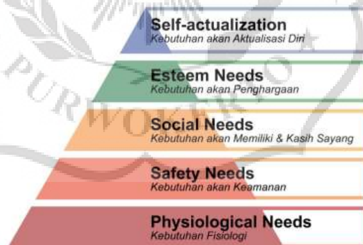
Gambar 2.1 Hierarki Kebutuhan Maslow

Berikut gambar Teori Hierarki Kebutuhan Maslow.