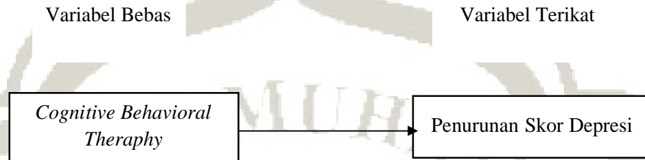
Gambar 2.3 Kerangka Konsep