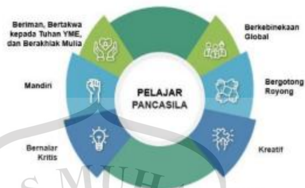
Gambar 2.1 Profil Pelajar Pancasila