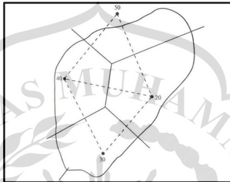
Gambar 2. 2 Poligon Thiessen

A_1, A_2, \dots, A_n : luas daerah yang mewakili stasiun 1,2,3,... n (m) 2