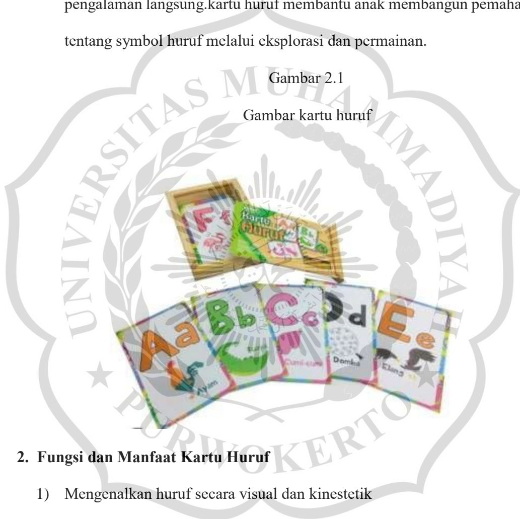
Gambar kartu huruf