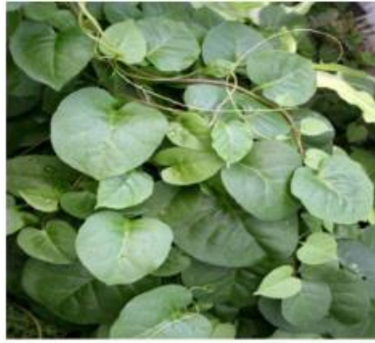
Gambar 2. 1 Tanaman Binahong ( Anredera cordifolia Ten. (Steenis))