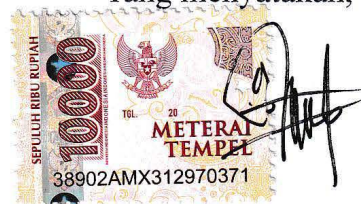
Bagus Ellang Permadi