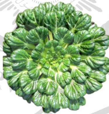
Gambar 2.1 Sawi pagoda

Sawi pagoda atau tatsoi ( Brassica narinosa L. ) mempunyai nama sinonim bayam mustard atau sendok mustard, merupakan sayuran daun yang banyak dibudidayakan di Asia, khususnya di China. (Yang et.al , 2019) Dan disebut juga sawi pagoda dan dapat di lihat di gambar 1. Tanaman ini merupakan keluarga Cruciferae ( Brassicaceae ) seperti juga kubis krop, kubis bunga dan brokoli juga lobak, mempunyai karakter morfologis tanaman yang serupa (yaitu perakarannya, batangnya, bunganya, buahnya atau polongnya serta bijinya (Saepuloh dkk, 2020).