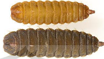
Gambar 1.3 Morfologi Larva dan Pupa BSF (McShaffrey, 2013; Fauzi dan Sari 2018).

tinggi, sehingga sangat cocok diterapkan di daerah sentra perikanan untuk menekan biaya produksi (Fahmi, 2018).