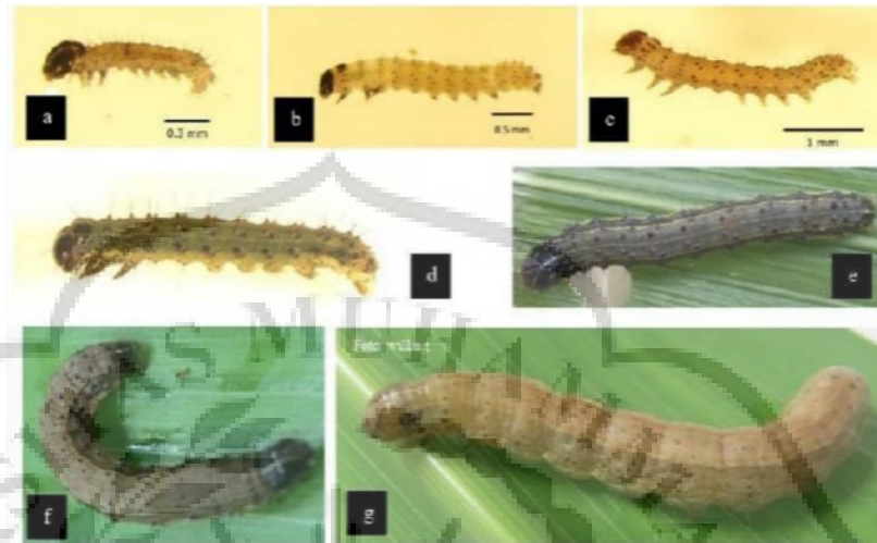
Gambar 2. 2 Perkembangan larva UGF (a), instar 1 (b), instar 2 (c), instar 3 (d) instar 4 (e), instar 5 (f) dan instar 6 (g), (BBPOPT, 2021).

tanaman jagung hanya ada satu atau dua saja. Tingkat perkembangan larva melalui enam instar dipengaruhi oleh makanan serta kondisi suhu, dan biasanya membutuhkan 14-21 hari.