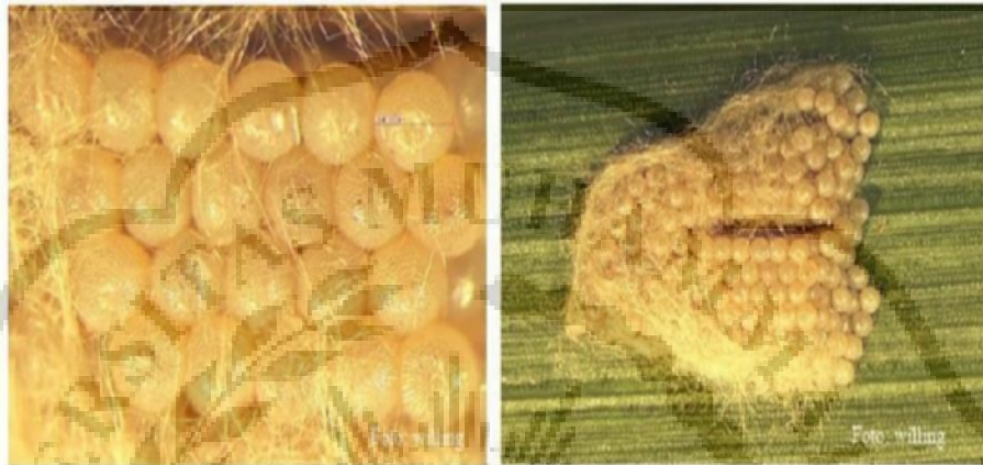
Gambar 2. 1 Kelompok telur UGF (BBPOPT, 2021)

30 °C. Telur biasanya diletakkan dalam kelompok sekitar 150-200 telur yang diletakkan dalam dua hingga empat lapisan pada permukaan daun. Massa telur biasanya ditutupi oleh lapisan pelindung, seperti abu-abu-merah muda (setae) dari bagian abdomen imago betina. Hingga 1000 telur dapat diletakkan oleh setiap betina.