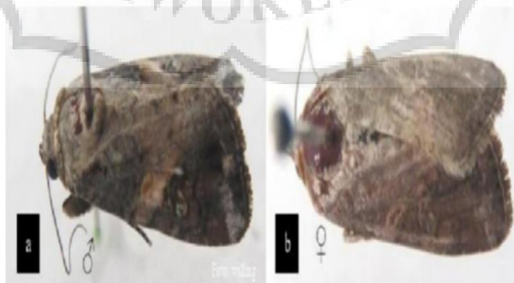
Gambar 2. 4 Imago (BBPOPT, 2021).

Imago UGF dewasa muncul pada saat malam hari, dan biasanya menggunakan periode pra-oviposisi alami untuk dapat terbang sejauh beberapa kilometer sebelum oviposit, kadang-kadang bermigrasi untuk jarak jauh. Rata-rata, imago hidup antara 12- 14 hari. Panjang tubuh imago jantan 1,6 cm dan lebar sayap 3,7 cm, dengan sayap depan bercak (coklat muda, abu-abu, jerami) dengan sel discal yang mengandung warna jerami pada tiga perempat area dan coklat tua pada seperempat area. Panjang tubuh imago betina adalah 1,7 cm dan lebar sayap 3,8 cm, sayap depan memiliki bintik coklat tua, abu-abu, dan warna jerami dengan margin coklat gelap.