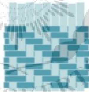
Gambar 2.2. Gambar Menganyam Dasar Ganda

Dari uraian tersebut, dapat disimpulkan bahwa menganyam adalah kegiatan menyusun dan menyilangkan helai-helai anyaman secara bergantian guna membentuk pola atau motif tertentu. Kegiatan ini memerlukan koordinasi antara gerakan jari tangan dan penglihatan (mata), serta dapat melatih ketekunan, kesabaran, dan konsentrasi anak selama proses pembelajaran berlangsung.