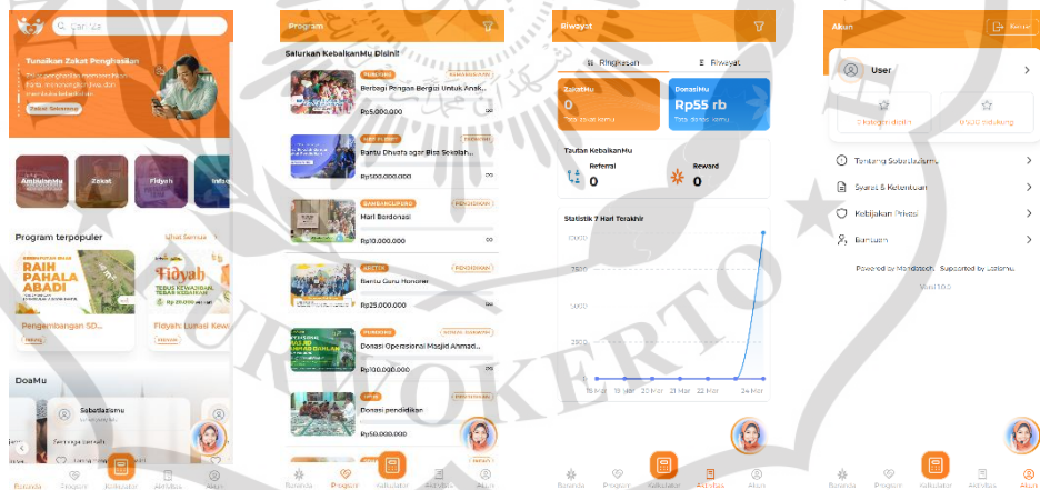
Gambar 2. 2 Tampilan Platform Sobatlazismu

Sobatlazismu adalah sebuah platform hasil kerja sama antara PT Mandatech Mataram Mukti dengan Lazismu Daerah Bantul untuk mendukung operasional Lazismu sebagai lembaga zakat nasional. Platform ini berfungsi sebagai sarana pengelolaan dan pemanfaatan dana zakat, infak, wakaf, serta donasi lainnya dari individu, lembaga, perusahaan, maupun instansi guna meningkatkan pemberdayaan masyarakat secara produktif. Visualisasi antarmuka pengguna dari platform Sobatlazismu ditampilkan pada Gambar 2.2.