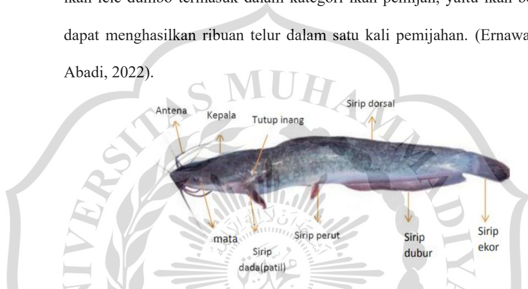
Gambar 2.1. Ikan lele dumbo ( Clarias gariepinus )

Lele memiliki tiga buah sirip tunggal, yaitu sirip punggung (dorsal), sirip ekor (caudal), dan sirip dubur (anal). Sirip punggung dan sirip dubur berfungsi untuk menjaga keseimbangan. Sirip dada dilengkapi dengan sirip yang keras dan runcing yang disebut patil. Menurut proses reproduksinya, ikan lele dumbo termasuk dalam kategori ikan pemijah, yaitu ikan betina dapat menghasilkan ribuan telur dalam satu kali pemijahan. (Ernawati & Abadi, 2022).