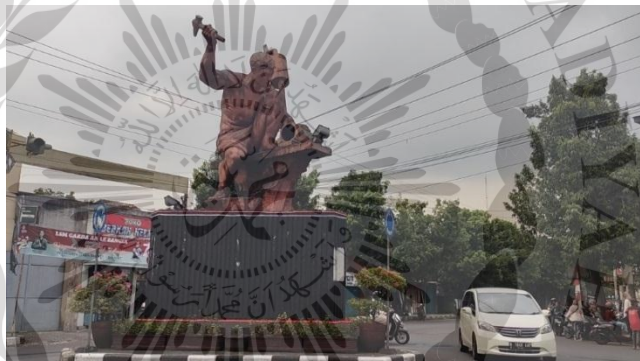
Gambar 2.2 Patung Knalpot di Purbalingga