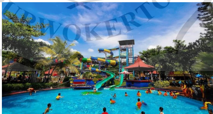
Gambar 2.6 Taman Rekreasi Owabong di Bojongsari, Purbalingga