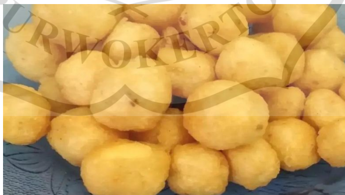
Gambar 2.3 Ondol dari Purbalingga