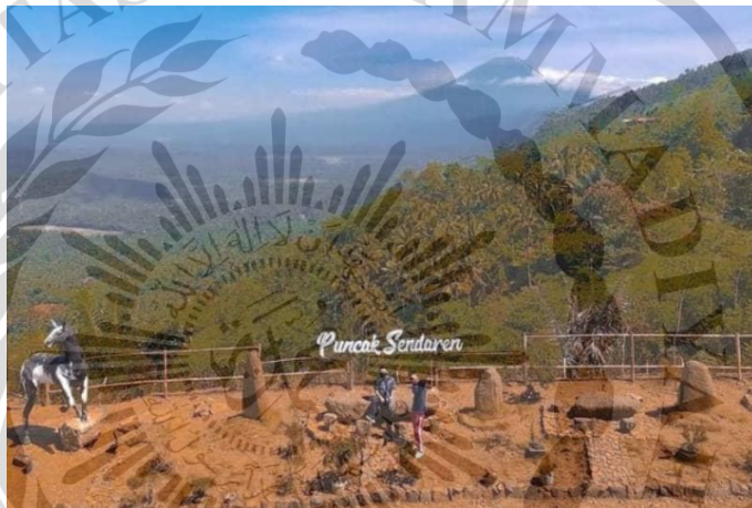
Gambar 2.5 Wisata Alam Puncak Sendaren di Rembang, Purbalingga