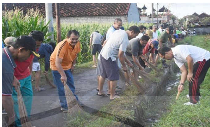
Gambar 2.7 Kegiatan Gotong Royong