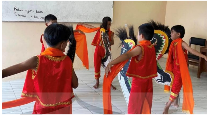
Gambar 2.4 Kesenian Kuda Lumping dari Purbalingga