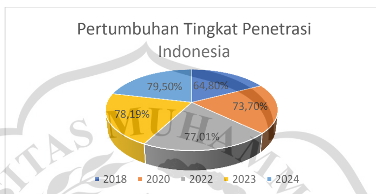
Gambar 1 : 1 Pertumbuhan Tingkat Penetrasi Indonesia

tujuan pendidikan Islam. Kolaborasi antara sekolah, keluarga, dan tokoh agama menjadi sangat penting dalam mengarahkan penggunaan teknologi ini. Dengan begitu, media sosial tidak hanya menjadi alat hiburan, tetapi juga sarana penguatan nilai-nilai keislaman.