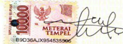
Agung Wahyu Nugroho