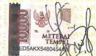
Wahyuni Nur Hidayati