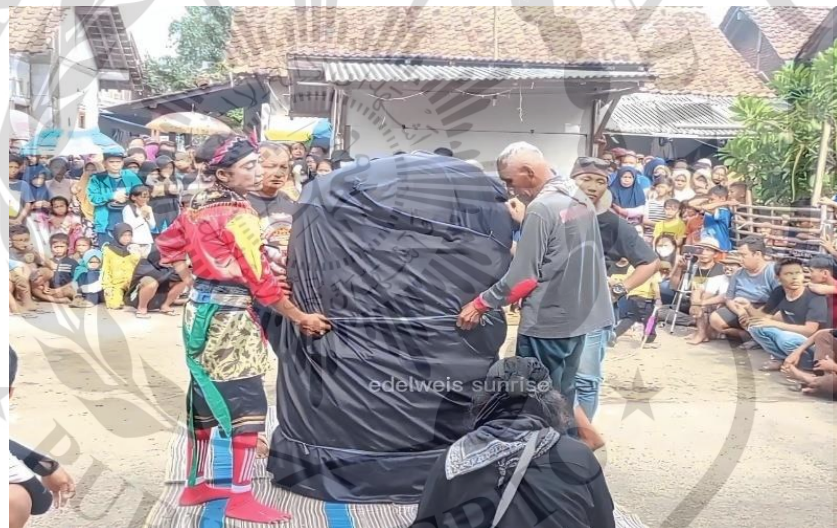
Gambar 3.1 Kurungan Sintren

Kurungan sintren merupakan pelengkapan yang sangat dibutuhkan ketika pementasan kesenian sintren berlangsung. Kurungan sintren berbentuk seperti kurungan ayam yang terbuat dari bambu dan ditutupi oleh kain yang menutupi seluruh kurungan setinggi 1,5 meter yang digunakan untuk mengurung sintren saat akan berubah kostum.