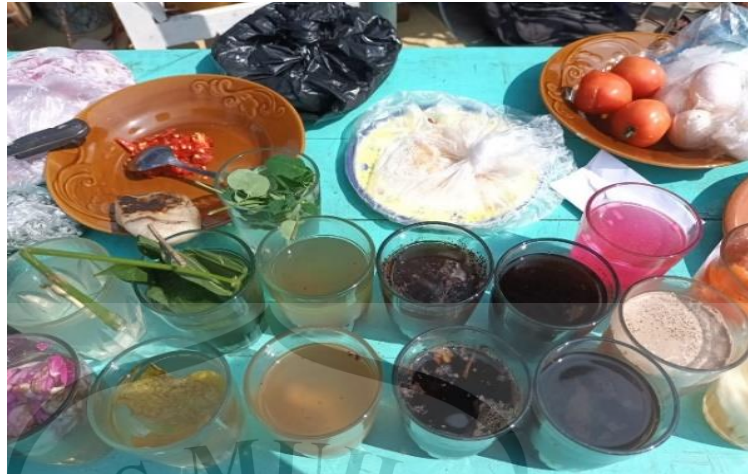
Gambar 3. 5 Sesajen

Disetiap pertunjukkan kesenian tari tradisional sebagian besar tidak terlepas dari adanya sesajen umumnya yang berhubungan dengan ritual keagamaan maupun upacara adat tertentu. Karena kesenian tari sintren pun tidak terlepas dari gaib tari sintren juga menggunakan beberapa sajen. Antara lain yaitu bunga kantil, bunga melati , bunga kenanga. Sesajen yang lain adalah kemenyan yang dibakar di atas penutup bunga kelapa yang sudah kering.