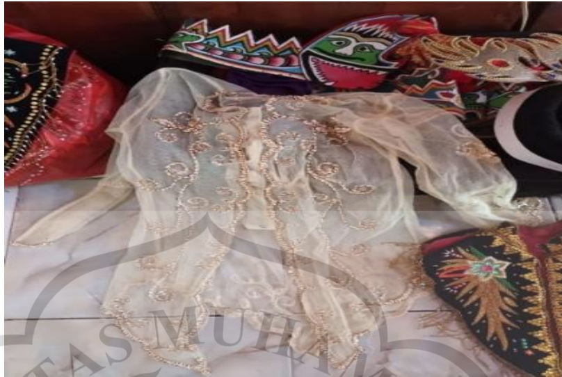
Gambar 3. 3 Baju Kebaya Modern