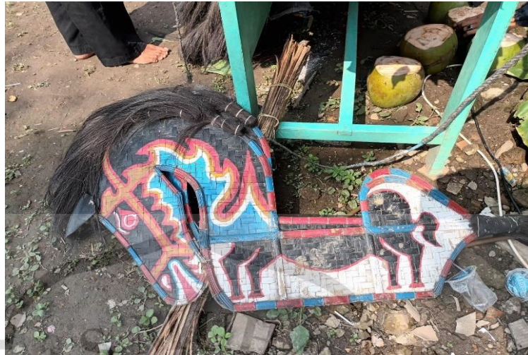
Gambar 3. 4 Eblek

Eblek terbuat dari anyaman bambu yang dibentuk seperti kuda penggunaannya yaitu dengan cara menaikinya seolah eblek adalah kuda. Namun dalam tari sintren eblek digunakan pada saat sebelum pertunjukan sintren karena sebelum pertunjukan sintren ada pertunjukan ebeg jadi para pemain ebeg yang memainkan eblek tersebut. Eblek digunakan untuk menahan kurungan disamping dan juga ditengah kurungan agar kurungan tidak geser/terbuka. Untuk eblek yang ada di paguyuban Sekar Wahyu Jati Utomo adalah eblek yang asli dibuat oleh Mbah Komar dan Istri rambutnya terbuat dari pohon aren yang di olah sampai menjadi ijuk, dan bentuk kudanya berasal dari bambu yang di anyam.