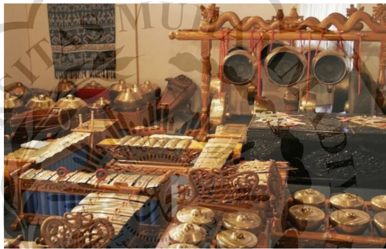
Gambar 3. 2 Set Lengkap Gamelan

Gamelan merupakan alat musik tradisional yang selalu dipakai di wilayah pulau jawa-bali untuk mengiringi acara pagelaran, ebeg, maupun kesenian tradisional lainnya. Gamelan yang lengkap terdiri dari saron, kendhang, gong, bonang, demung, kenong, kempul dllnya.