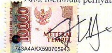
Tri Ajeng Mulya

Purwokerto, 2 Agustus 2023 Yang membuat pernyataan,