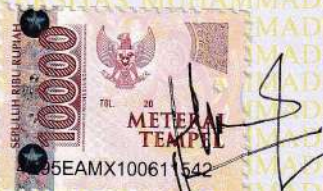
Rima Nur Faizah