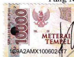
Rima Nur Faizah