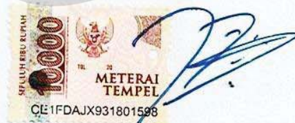
Panggih Restu Panjalu