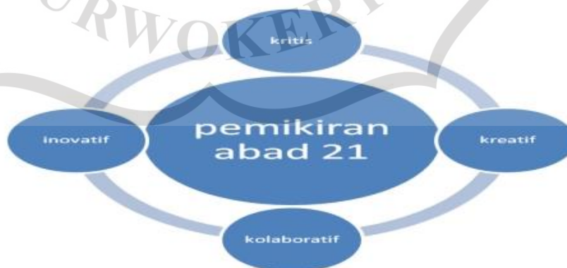
Gambar 2.1 Skema Pemikiran Abad 21

Pemerintah dalam hal ini menjadikan kebiasaan membaca sebagai kegiatan wajib bagi setiap anak dengan harapan kelak menjadi budaya dalam kehidupan mereka. Untuk itu pemerintah mengajak seluruh stakeholder pendidikan ikut andil dalam kegiatan tersebut, mulai dari keluarga, sekolah hingga masyarakat. Selain memasukkan kewajiban membaca dalam setiap kegiatan pembelajaran di kelas pemerintah juga memiliki empat hal yang dilakukan untuk memajukan dunia pendidikan melalui proses yang berlangsung di sekolah yaitu: Pemikiran abad 21 yang menuntut peserta didik untuk berfikir kritis, kreatif, inovatif, serta kolaboratif. Pengembangan budaya berfikir abad 21 menghendaki proses pendidikan tidak hanya menghasilkan winner and loser , pemenang dan pecundang namun diharapkan seluruh peserta didik dapat berhasil dalam mengembangkan potensi dalam diri mereka. Oleh karena itu dalam pembelajaran yang dikehendaki bukanlah tuntasnya materi namun tuntasnya kompetensi yang dikuasai setiap peserta didik.