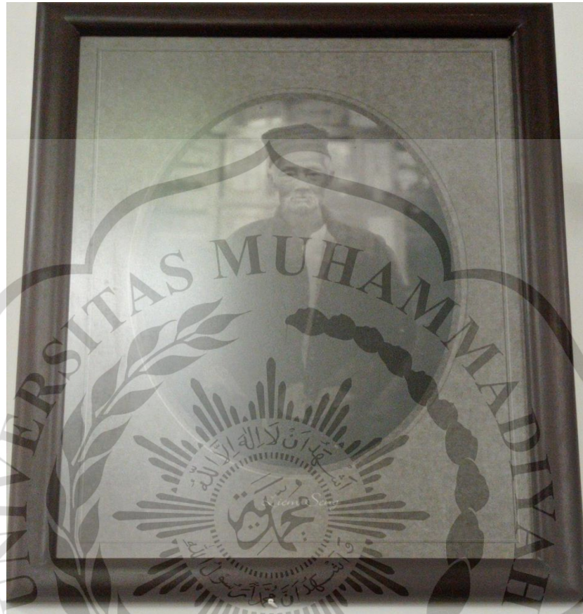
Gambar 1.3 Foto Liem Kiem Seng (Sumber: Arsip Museum Roemah Martha Tilaar )