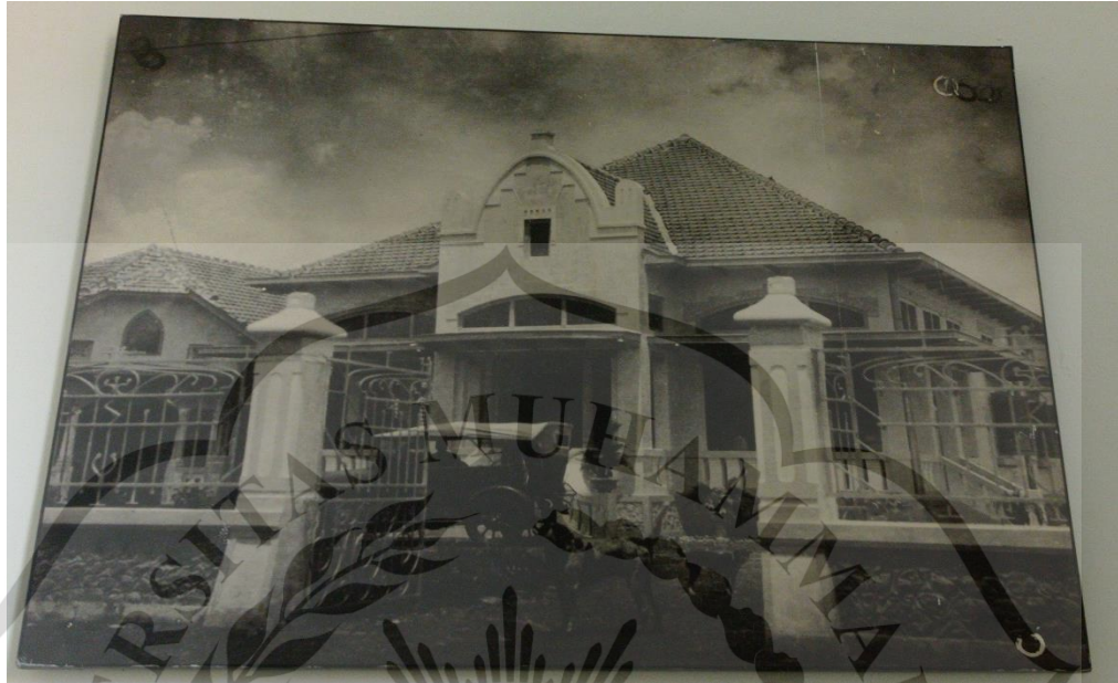
Gambar 1.2 Museum Roemah Martha Tilaar Tahun 1920