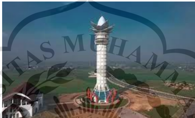
Gambar 1. 1 Objek Wisata Menara Pandang Purwokerto

April 2022. Menara ini dibangun dengan biaya program Pemulihan Ekonomi Nasional (PEN) dari dana Anggaran Pendapatan dan Belanja Negara (APBN) (Wenny, 2022). Menara Pandang menjadi salah satu destinasi wisata yang terkenal di Kabupaten Banyumas, hal ini dikarenakan Menara Pandang menawarkan pemandangan panorama Kota Purwokerto yang dapat dilihat dari atas gedung menara (Gambar 1.1).