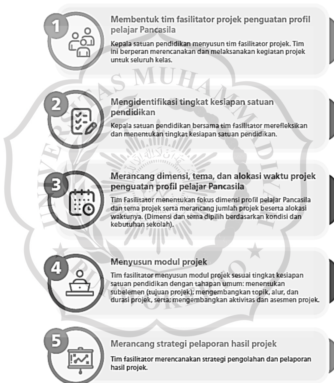
Gambar 1.1 Alur Perencanaan Proyek (Kemendikbudristek, 2020 )