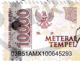
Bertiana Khoirul Khuthwah

Dibuat di : Purwokerto Pada Tanggal : 9 Januari 2025 Yang menyatakan,