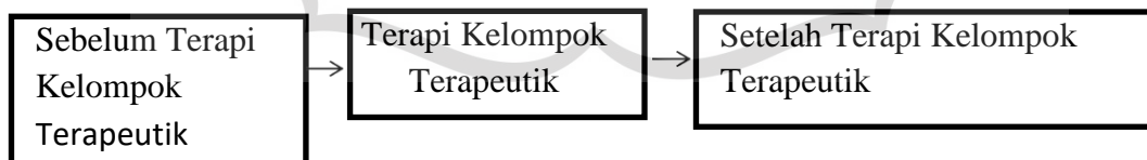
Gambar 2.2 Kerangka Konsep

Kerangka konsep adalah awal dari pemikiran yang nantinya dapat memunculkan uraian tentang perkiraan yang telah dicantumkan dalam hipotesa. Dalam penelitian ini, kerangka konsep yang dapat diperoleh peneliti yaitu: