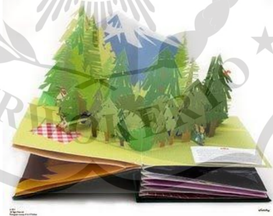
Gambar.1 Pop up book

Dapat disimpulkan dari beberapa paparan di atas bahwa dengan menggunakan pop up book dalam pembelajaran khususnya Bahasa Indonesia memberi manfaat sebagai berikut. 1. meningkatkan semangat dan motivasi serta minat peserta didik dalam belajar Bahasa Indonesia yang awalnya cenderung membosankan; 2. menumbuhkan rasa ingin tahu yang tinggi untuk mengetahui hal-hal baru yang akan dipelajari; 3. merangsang imajinasi dan mengembangkan kreatifitas peserta didik dalam mengungkapkan argumen-argumennya; 4. membantu mempermudah memahami materi dengan sajian visual-visual yang menarik dan tidak membosankan bagi peserta didik; 5. mengembangkan kemampuan berpikir kritis dan kreatif peserta didik sehingga peserta didik tidak monoton hanya diberikan materi oleh pendidik.