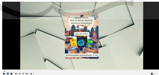
Gambar 2. Pop up book digital

Berdasarkan uraian di atas, dapat disimpulkan bahan ajar pop up book digital merupakan inovasi baru dalam dunia pendidikan khususnya dalam bahan ajar yang mengikuti perkembangan teknologi dengan menampilkan elemen dua dimensi dan gerak gambar seperti animasi. Pop up book digital memberikan visualisasi materi yang menarik. Bahan ajar ini juga memiliki daya tarik sendiri ketika halaman dibuka, yaitu dengan timbulnya setiap gambar dan tulisan didalamnya. Sehingga bahan ajar pop up book digital kompeten digunakan sebagai alat bantu pembelajaran dan belajar mandiri di tingkat SMP.