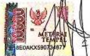
Putri Indra Nuraini