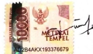
Nur Lela Afrianti