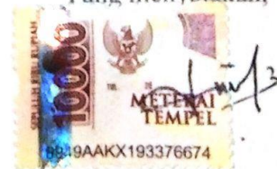
Nur Lela Afrianti